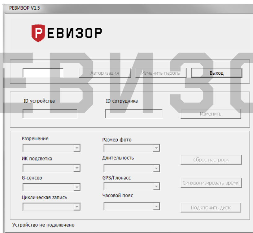
Рисунок 3 - Окно входа в систему

Выберите соответствующий пароль и нажмите кнопку «Авторизация». Пароль пользователя – 000000.