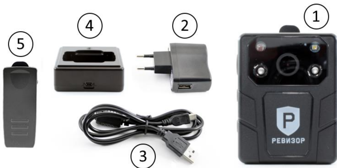
Рисунок 1 – Комплектация персонального регистратора

Ниже представлена комплектация персонального регистратора (рис. 1):